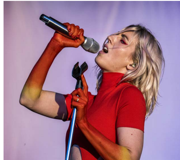
Veronica Maggio spelar på Åre Sessions.