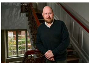
Henrik Dorsin gör ännu en stor dramaroll i tv-filmatiseringen av Hans Rosenfeldts roman "Vargasommar".